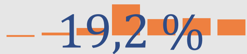
PBI Var. Interanual a mar-22