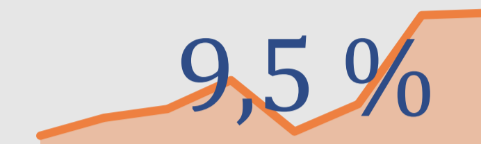
Inflación Interanual jun-22