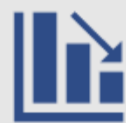
Bancos Múltiples, de Ahorro y Crédito